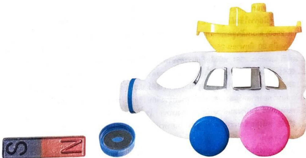
▲ ภาพที่ 4.27 ตัวอย่างผลงานรถพลังแม่เหล็ก