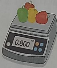
พริกหวาน 4 ลูก น้ำหนัก