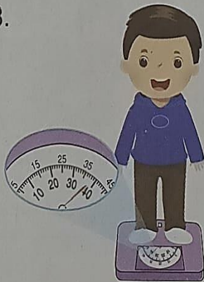
ม่อนหนัก