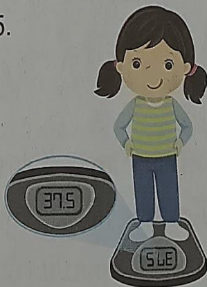
ดรีมหนัก