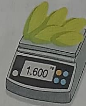
ข้าวโพด 5 ผัก น้ำหนัก