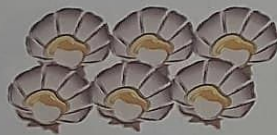
หอยเชลล์ 6 ตัว