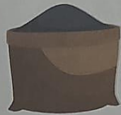
ดิน 1 ถุง