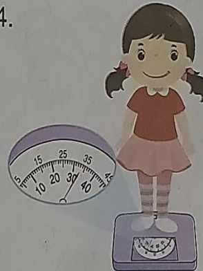
แต้วหนัก