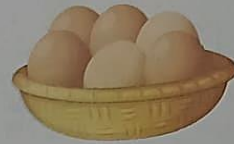
ไข่ไก่ 6 ฟอง