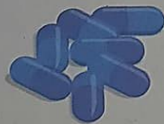
ยาแคปซูล 7 เม็ด